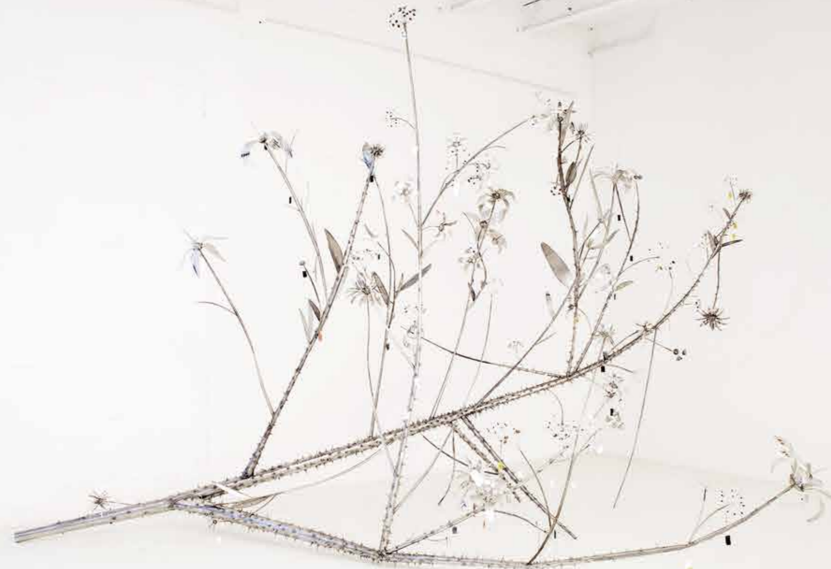
CROCEFFISSIONE GRÜNEWALD 2017, CM. 500 x 350 x H. 320 INSTALLAZIONE LAMIERA DI FERRO