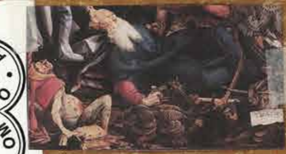
RINGRAZIO GUIDO PIACENTINI, ADRIANO GENTILUCCI LABORATORIO DELL'IMPERFETTO