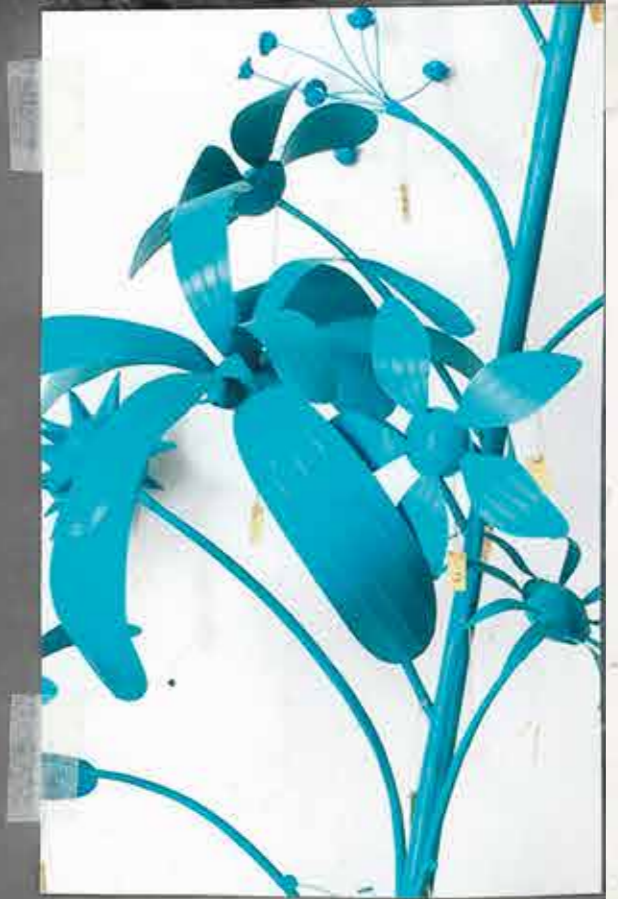
AMOR RELESTE TURCHINO 2046, CM. 90 X 110 X H. 260 INSTALLAZIONE OLIO SU LAMIERA DI FERRO

UNA PIETROVA - FATA TURCHINA - L'UCIENA DEI BARBANI - L'ILLUSIONISTA N. MARCONI - MAGICO - L'ELFANTE VINCIANO - CARO DI 20 - F. G. M. M. M. - Oscar R. Bialla