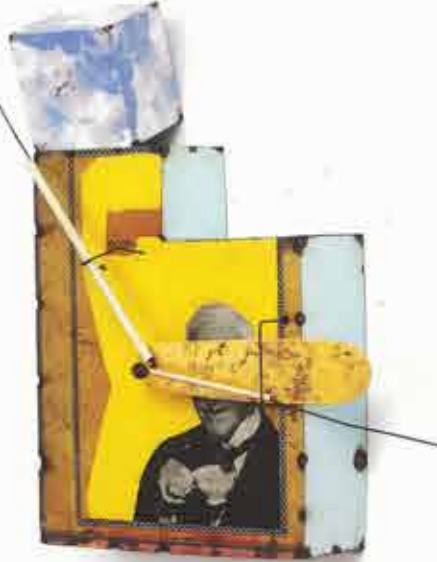
BUON DIO 2011, CM. 32 x 34 x P. 13 MECCANISMO A PARETE OLIO SU LAMIERA DI FERRO