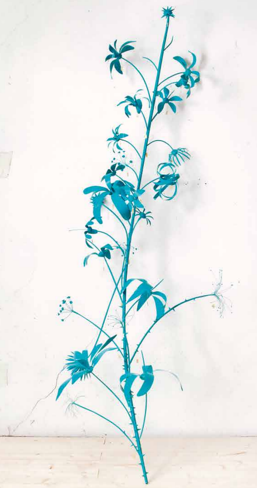
FRANCESCO BOCCHINI CARNIVAL