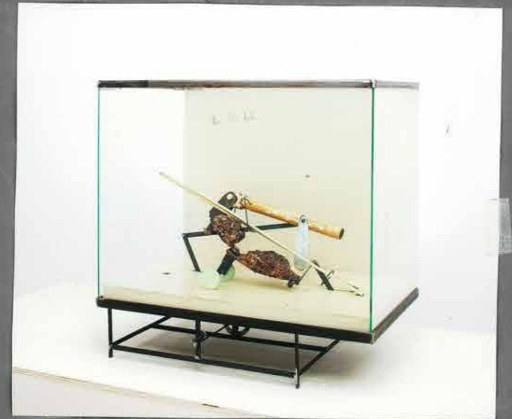
OSCAR RALF BIALLA 2042, CM. 60 X 44 X H. 54 MECCANISMO A SACAMENTO OLIO, VETRO, FERRO

STUDIO CENACCHI ARTE CONTEMPORANEA VIA SANTO STEFANO 63 40125 BOLOGNA - ITALIA +39 265547 INFO @ STUDIOCENACCHI.COM WWW.STUDIOCENACCHI.COM