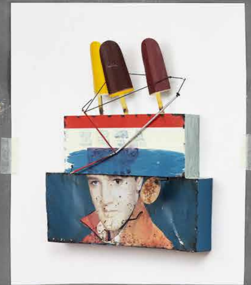
L'IMPERO DEI SENSI E DEGLI APPLAUDITORI SEMPRE CIECHI 2047, CM. 42 X 52 X P. 42 MECCANISMO A PARETE OLIO SU LAMIERA DI FERRO