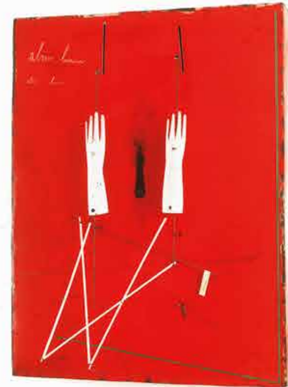
UN ARSICO LUMINOSO 2017, CM. 92 x 111 x P. 27 MECCANISMO A PARETE OLIO SU LAMIERA DI FERRO