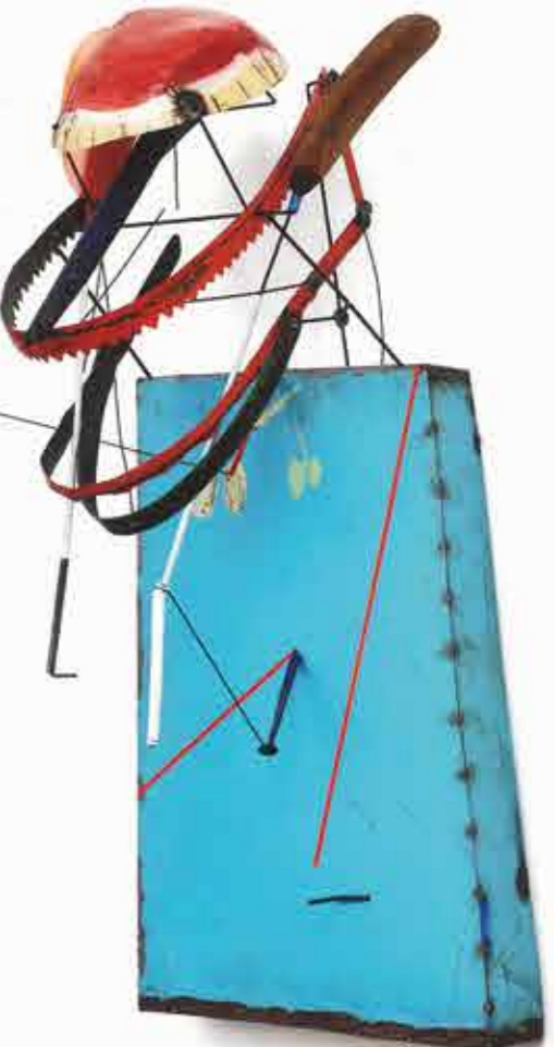
TESTA DI SCIMMIA CANNIBALE 2017, CM. 35 x 75 x P. 34 MECCANISMO A PARETE OLIO SU LAMIERA DI FERRO